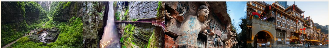
อุทยานแห่งชาติหลุมฟ้า 3 สะพานสวรรค์